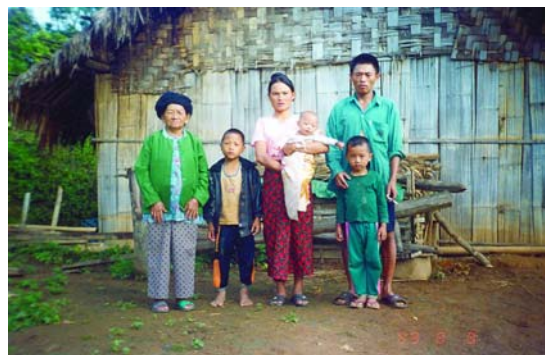
泰北同胞們在沒水、沒電、泥巴地上茅草屋的困苦生活

我一直以為人生活在有情有味的世界，實在是天賦的幸福。何不妨將這份幸福與他人分享。而在扶輪的國際服務不就是教我們要有所謂四海一家，同舟共濟的胸懷——關懷世界任何角落需要關懷的人們。更何況有一群我們昔日袍澤後裔，非他們所願的長期散居泰、緬之偏遠山區，其間無橫向及主要對外交通路線，環境之惡劣、物資之缺乏、生活之艱苦，實非一般人所能想像。而對於這群泰北同胞們，在過去唯一的幫忙方法，又都是捐助大量的物資。可是往往大批的生活物資到了泰北村落，馬上就被換成生活必需品，而無法真正實質的改善泰北同