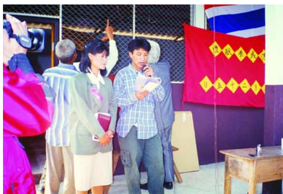
回馬村村民代表：各位扶輪善心人士對我們的支持和幫助，我們永遠都不會忘記。

回馬村村民代表致謝詞表示：「今天承蒙國際扶輪社幫助我們回馬村捐助整村重建，我們難民能有這福份完全是因為您們的善舉，我僅代表全體村民竭誠歡迎，同時感到欣喜、榮幸，而且非常感激。過去我們住的是簡陋茅屋，現在能有這遮風避雨的房子，完全是您們的幫助，中華民國政府以及各位扶輪善心人士對我們的支持和幫助，我們永遠都不會忘記。最後希望能自助人助下，展現出更大的成果，增添這世界繁華的生機。遷移新居後，我們面臨的困難是村民飲水以及村子道路的問題，希望各位