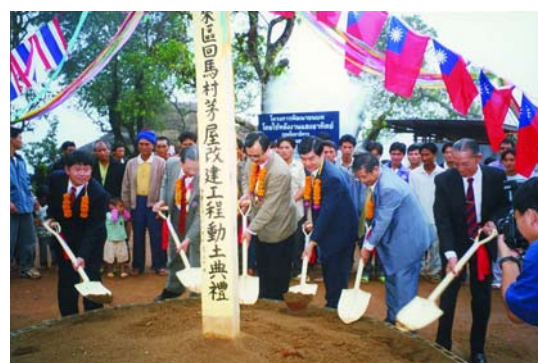
全地區社友的愛心陪伴下我們共同鏟下一坯土，所種下一顆希望的種子，而今業已

三個月後，當泰方建商將新建的回馬村大門、村內道路及 34 戶五口以上房屋及 15 戶五口以下之房屋落成的相片寄至我的手中時。望著相片中嶄新的大門高聳著“扶輪和平村”(Rotary Peace Village) 以及每間嶄新的水泥屋舍及村內歸劃整齊道路時，心中從提出計劃以來就一直存在的重擔，至此終於放了下來。想著當時為著一份“真誠禮物”送愛到泰北——重建清萊回馬村的扶輪信念而帶領地區秘書長、地區國際服務主委、行動委員等相關人員艱辛冒險勘察。並在全地區社友的愛心陪伴下我們共同鏟下一坯土，所種下一顆希望的種子，而今業已發芽、業已成長。念及此，不覺間嘴角飽含著「感動」欣然的笑意，並默禱願上蒼讓社友們有情有味的愛心永遠、永遠照拂著泰北『扶輪和平村』的回馬村民。