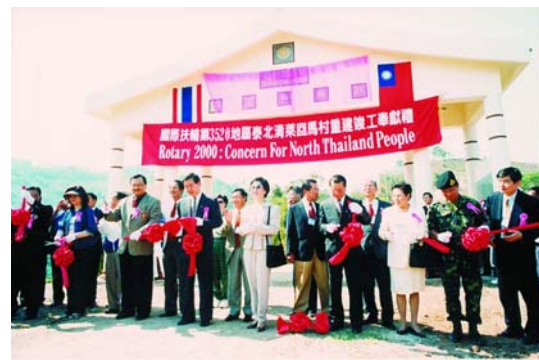
扶輪和平村落成奉獻禮