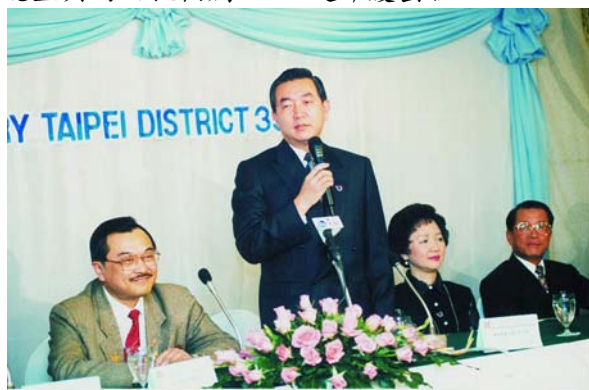
焦委員長感性的述說著僑務的艱困