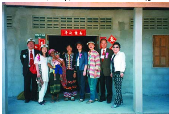
讓我們共同體認生命真正意義