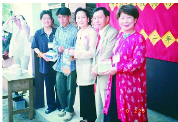
華樂扶輪社贈送恩泉小學文具、鉛筆