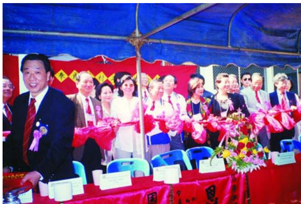
各社社長剪綵儀式

同時，在此必須說明原來的回馬村因為是位於水源地，為避免森林遭到破壞，泰國森林廳不但不准其改建，並命令回馬村民必須搬遷，至泰方指定的這塊荒地上開闢新居。重建後我們扶輪將其定名為「扶輪和平村」，並以中、英、泰文刻寫於大門牌樓之上。啟用典禮後，村民即可遷入新居。我們國際扶輪第 3520 地區此次在泰北重建義胞村（扶輪和平村），是台灣繼濟功德會和救災總會等協助義胞們建設新家園的第三個社團。