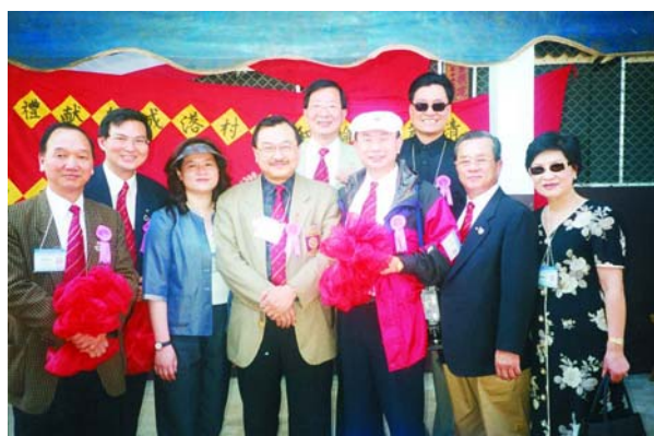
Governor 2000 Dens 與領導人合影