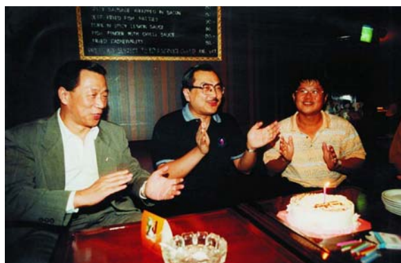
88.10.30 破土動工與工程簽約日正是 DG Dens 五十大壽，於 Dusitiland 飯店慶生