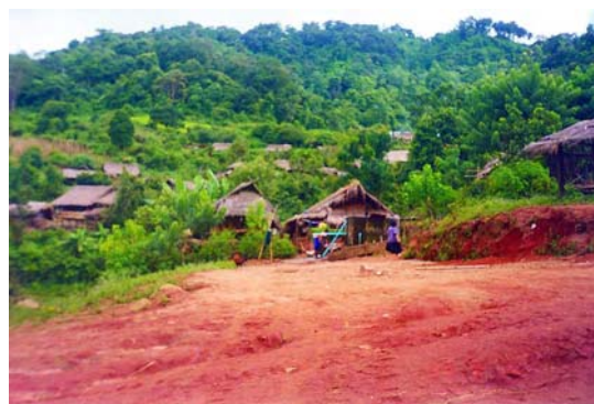
潮濕陰暗的茅草房