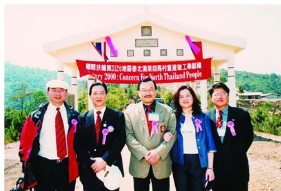
Governor 2000 Dens 堅強的服務團隊