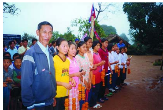
小朋友害羞靦腆的為我們掛上自製的花環

三個月後，當泰方建商將新建的回馬村大門、村內道路及 34 戶五口以上房屋及 15 戶五口以下之房屋落成的相片寄至我的手中時。望著相片中嶄新的大門高聳著“扶輪和平村”(Rotary Peace Village) 以及每間嶄新的水泥屋舍及村內歸劃整齊道路時，心中從提出計劃以來就一直存在的重擔，至此終於放了下來。想著當時為著一份“真誠禮物”送愛到泰北——重建清萊回馬村的扶輪信念而帶領地區秘書長、地區國際服務主委、行動委員等相關人員艱辛冒險勘察。並在全地區社友的愛心陪伴下我們共同鏟下一坯土，所種下一顆希望的種子，而今業已發芽、業已成長。念及此，不覺間嘴角飽含著「感動」欣然的笑意，並默禱願上蒼讓社友們有情有味的愛心永遠、永遠照拂著泰北『扶輪和平村』的回馬村民。