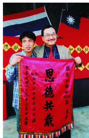
回馬村全體村民以「恩德共戴」錦旗敬獻給我們地區