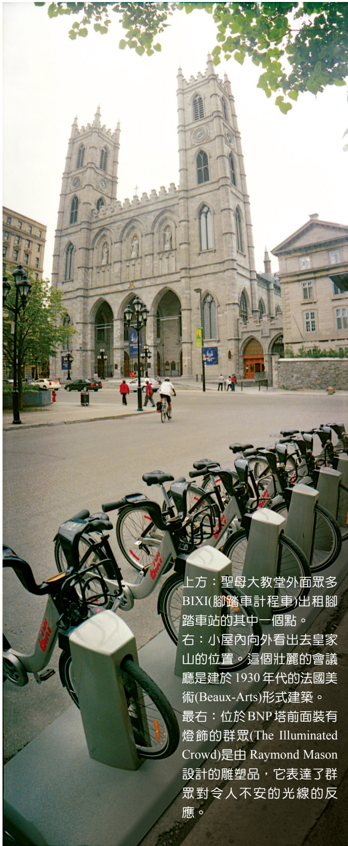
上方：聖母大教堂外面眾多BIXI(腳踏車計程車)出租腳踏車站的其中一個點。