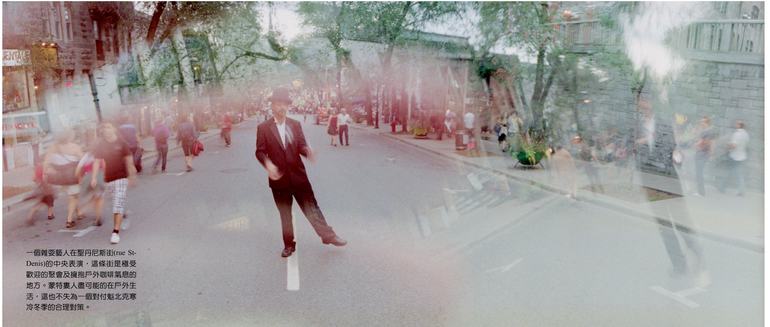
一個雜耍藝人在聖丹尼斯街(rue St-Denis)的中央表演，這條街是極受歡迎的聚會及擁抱戶外咖啡氣息的地方。蒙特婁人盡可能的在戶外生活，這也不失為一個對付魁北克寒冷冬季的合理對策。

的敬畏感覺常常伴隨著眾人屏氣凝神的讚嘆。內部裝潢大部份是木雕，這個計畫本身就花了30年。它彩色的玻璃窗戶是來自法國的利摩哥斯(Limoges)，而紀事的故事則來自於蒙特婁的歷史及聖經。這個教堂值得你花數小時來細細品味。不只一個的蒙特婁人指出當地的首席女歌星席琳狄翁在1994年在此結婚，這是極為合理的事實。